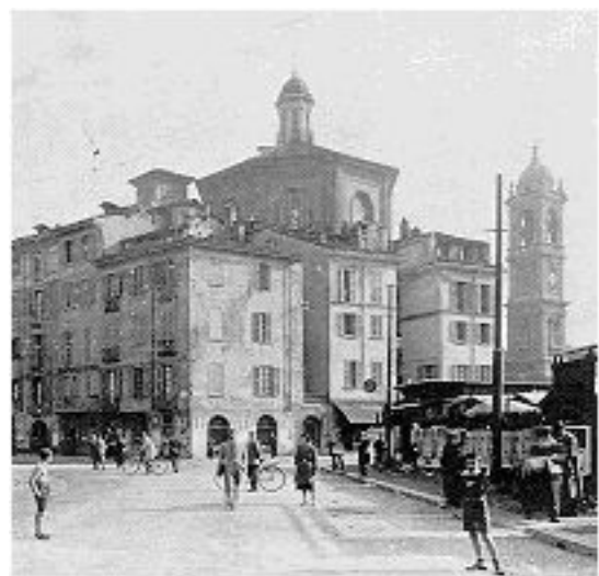
Larga, 1920.