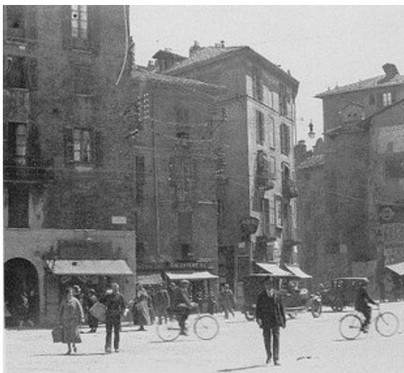
Via della Signora, 1920. Milano, Civico Archivio Fotografico del Castello Sforzesco.

Nella chiesetta attigua di S. Bernardino alle Ossa - danneggiata dalla caduta del campanile di S. Stefano nel 1642 - da tempi lontani erano conservate delle ossa, onorate devotamente; secondo la tradizione questi resti si attribuivano a un eccidio avvenuto per mano degli ariani all'epoca di S. Ambrogio, ma, più verosimilmente, trattavasi degli scheletri di poveri malati, morti nel vecchio ospedale del Brolo; mentre nelle cripte erano posti i cadaveri di priori e frati che dirigevano l'ospedale. Nel secolo XV, quando S. Bernardino fu santificato (1450), i Disciplini, che avevano fondato una scuola proprio nei pressi della chiesetta, ne assunsero la custodia e la consacrarono al loro patrono. L'edificio, più volte rimaneggiato nel corso dei tempi, a causa di distruzioni, incendi e demolizioni, è ancor oggi in piedi, con il suo ossario, che ha la fronte verso il vicolo, assai angusto, detto di S. Bernardino. Quest'ultimo si incontra con via della Signora, che prende il nome, secondo alcuni studiosi, da una ipotetica monaca benefattrice.